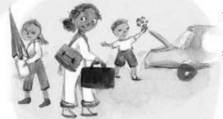
FLEXIBILITÉ DES VACANCES