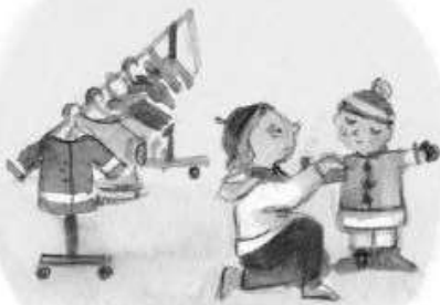
FLEXIBILITÉ DES HORAIRES