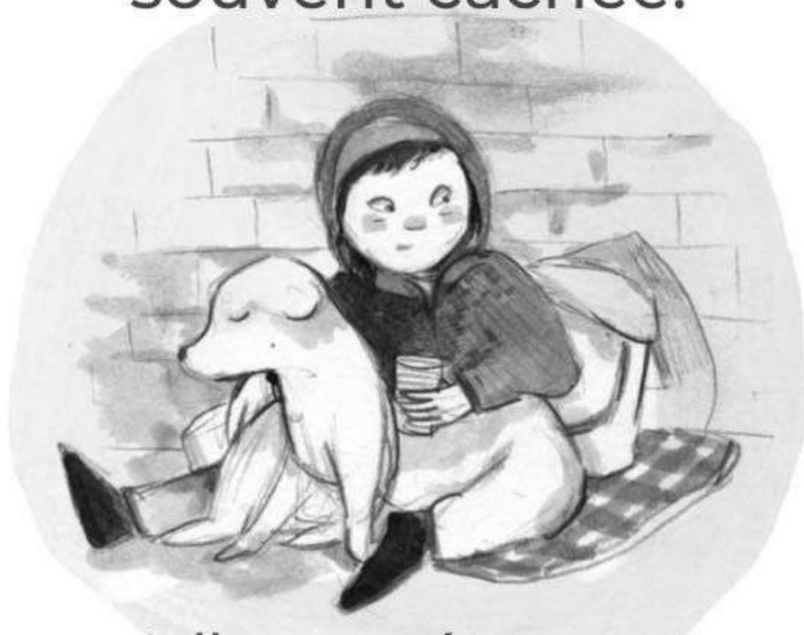
Illustration: Mathilde Cinq-Mars

L'itinérance des femmes est souvent cachée.