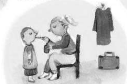
BANQUE D'HEURES OU DE TEMPS ACCUMULÉ